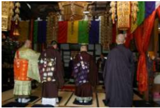
昨年 の 式典