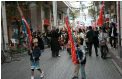
昨年 の おねり