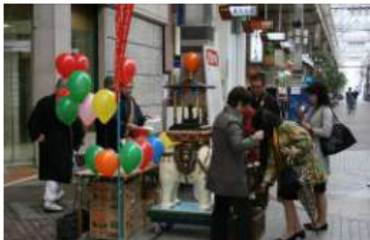
昨年 の 灌仏